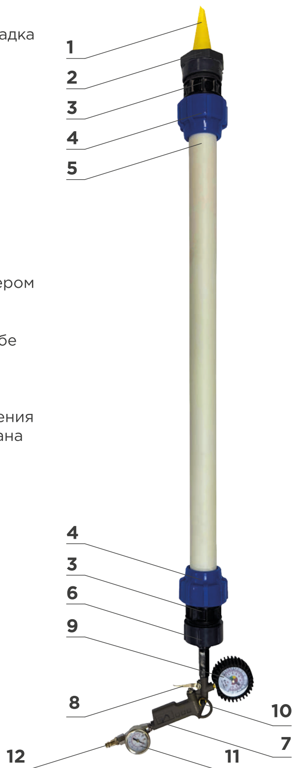
Рисунок 1. Общий вид